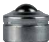
serie senza collare