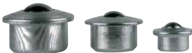
serie con collare

I carichi indicati nelle tabelle sono validi per temperature d'impiego da -30°C a +70°C (con punte fino a 100°C).