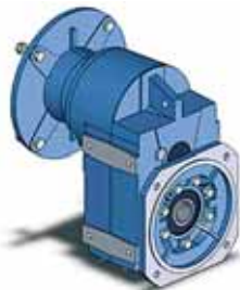
serie S - PS