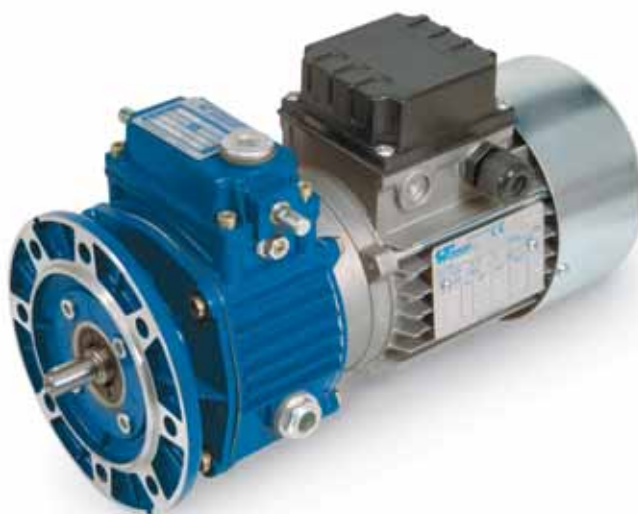
serie ST - SF - SC